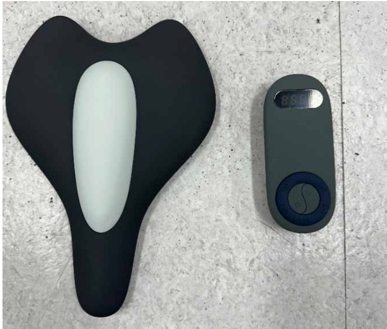
< 후 면 >