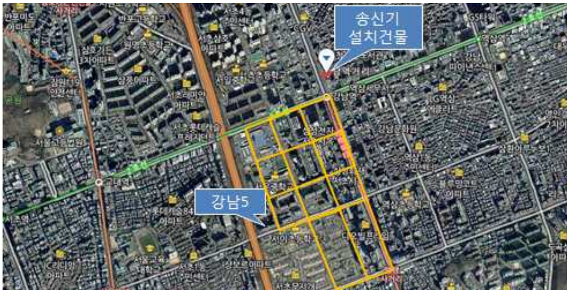
그림 281 강남 5 측정구간

강남5는 송신기 설치건물 남서쪽에 위치하며, 고층 아파트, 학교, 고층 상업용 건물이 밀집해 있으며, 이 구간의 블록은 980m x 480m로 송신기 설치건물에서 가까운 곳에 삼성전자, 삼성생명 등 초고층 빌딩이 가로막고 있다.