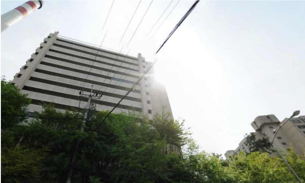
그림 392 강남 15 지점 남쪽 전경