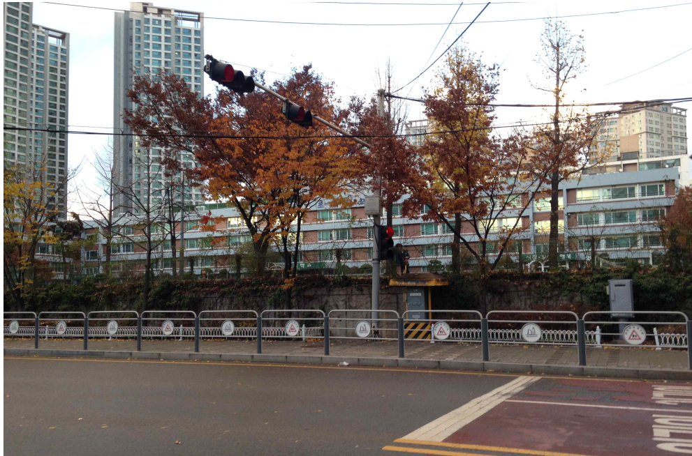
그림 390 강남 15 지점 북쪽 전경