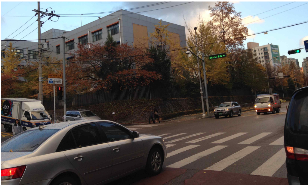
그림 391 강남 15 지점 동쪽 전경