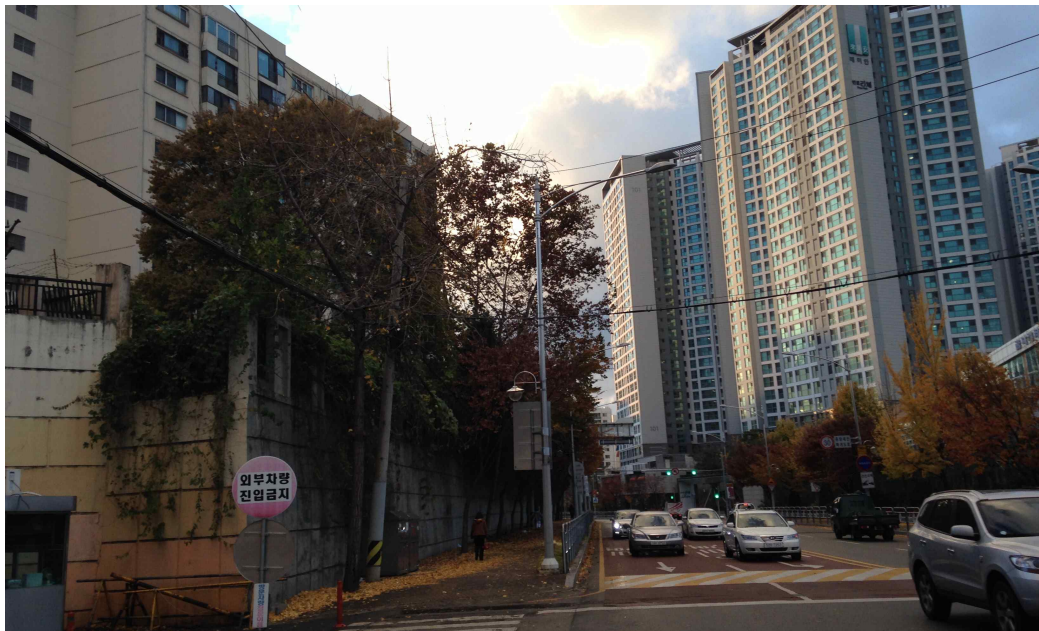
그림 393 강남 15 지점 서쪽 전경