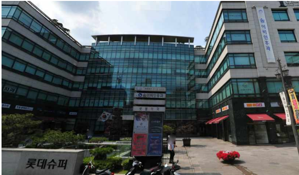
그림 378 강남 14 지점 북쪽 전경