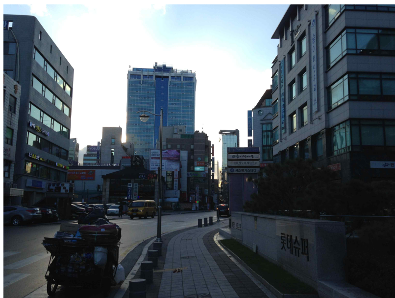
그림 381 강남 14 지점 서쪽 전경