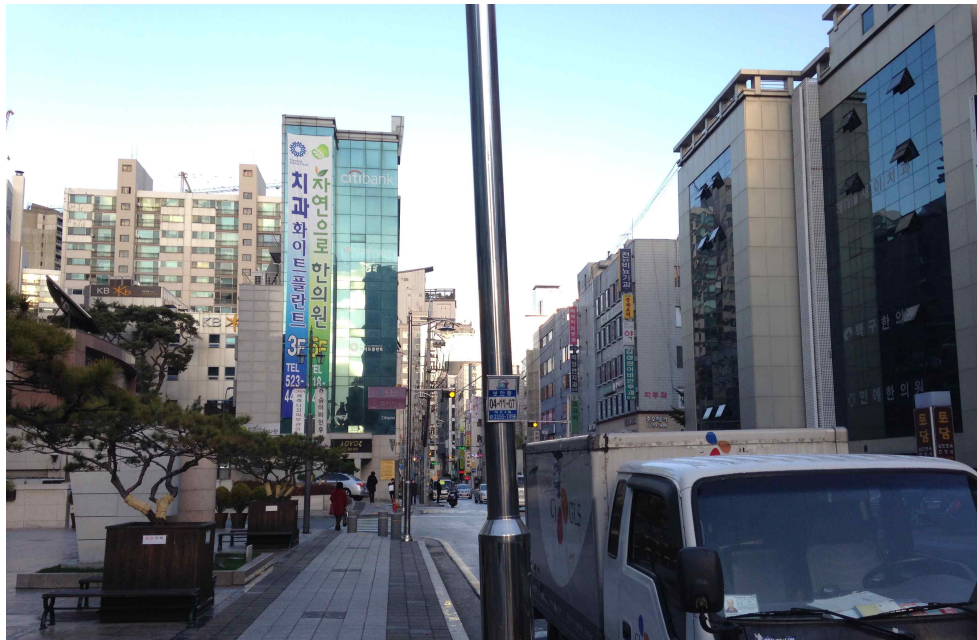
그림 379 강남 14 지점 동쪽 전경