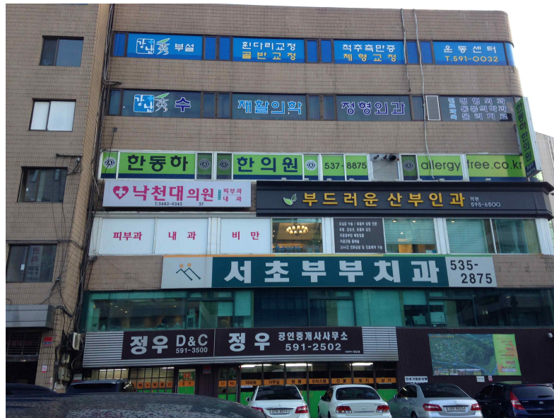
그림 380 강남 14 지점 남쪽 전경