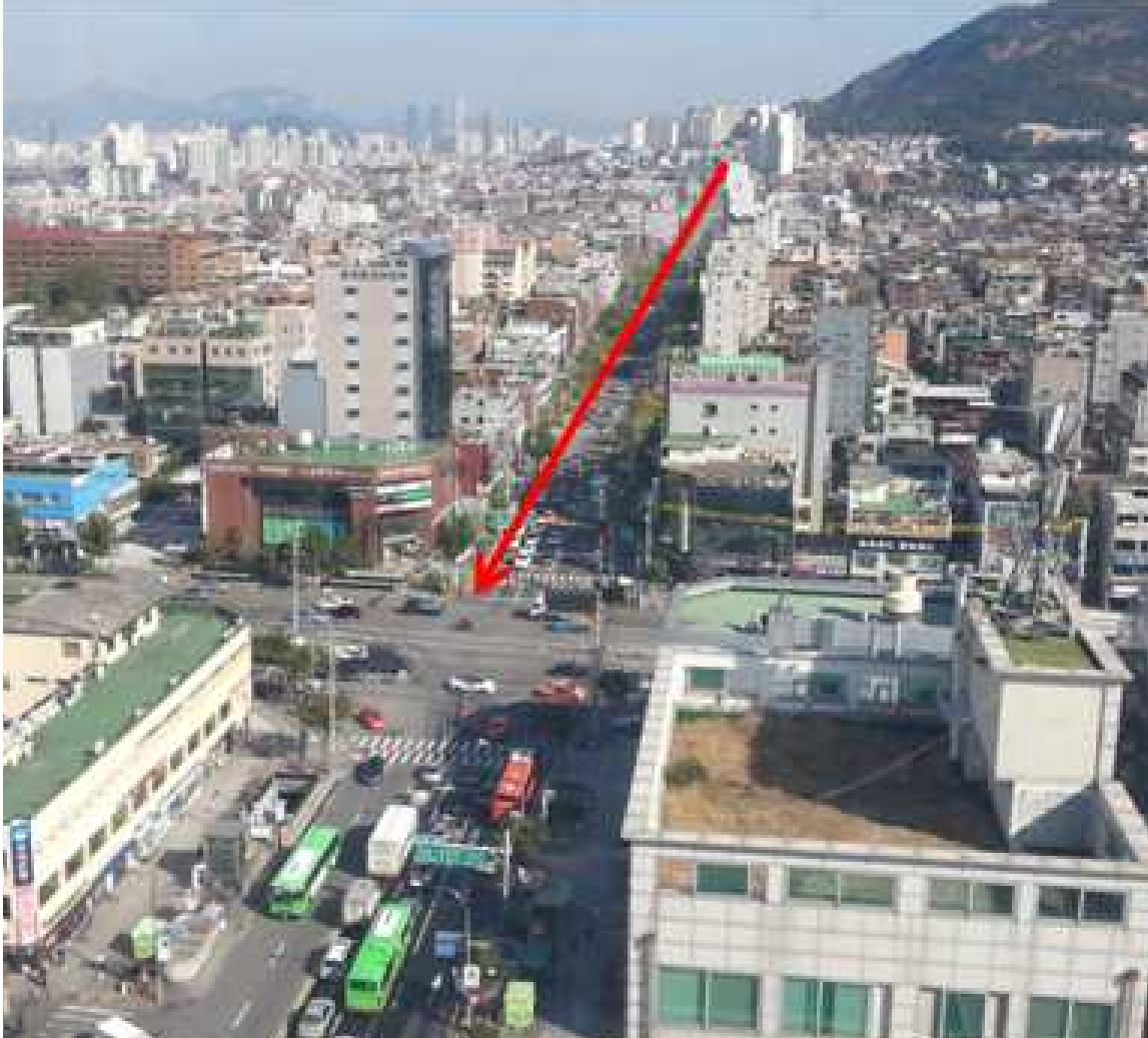
그림 11 능동 송신소에서 바라본 능동 16 측정 구간